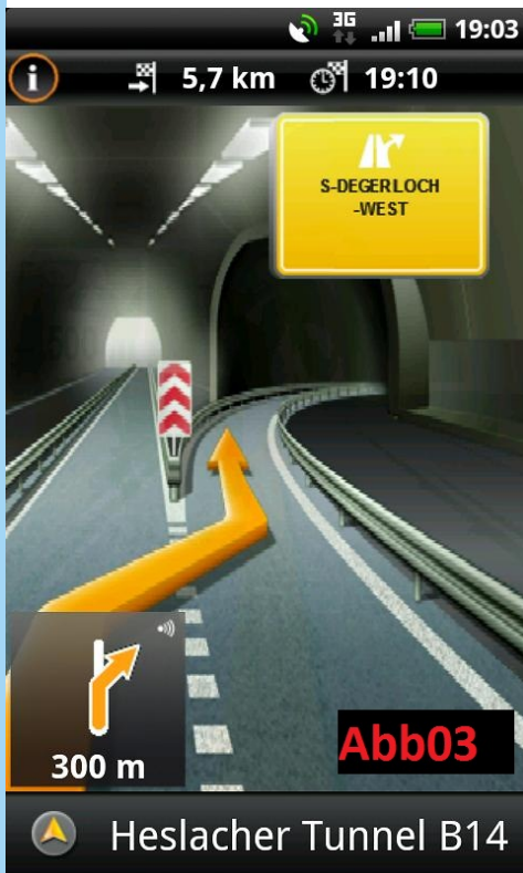
Heslacher Tunnel B14

Der Fahrspur-Assistent zeigt rechtzeitig vor Abzweigungen an, wo es lang geht und mit der Reality Pro Ansicht bekommt man eine klare Übersicht wohin man fahren muss. Dazu werden die sogenannten „Überkopfwegweiser“ der gerade befahrenen Stelle, und auch eine Grafik mit der zu benutzenden Fahrspuren, am Display des Gerätes angezeigt. (Abb03)